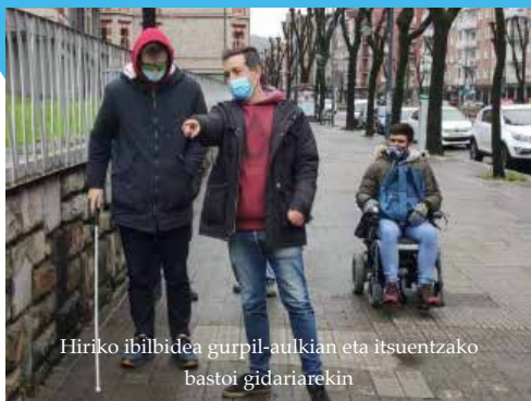
Hiriko ibilbidea gurpil-aulkian eta itsuentzako bastoi gidariarekin

Emilio Campuzano LHII LHiko Eraikuntza Proiektuen Zikloko 1. mailako ikasleek, FEKOORen (Bizkaiko Ezgaitasun Fisiko eta/edo Organikoa duten Pertsonen Federazio Koordinatzailearen) eskutik, Bilbon zehar egindako ibilbide batean, ikusi ahal izan dute zein oztopo dituzten ezgaitasun desberdinak dituzten pertsonak. Gure hirietako oztopo arkitektonikoez kontzientziatzeko balio izan die, formakuntzako proiektuei eta etorkizuneko lan mundurako erronkei aurre egiteko aukera eman die.